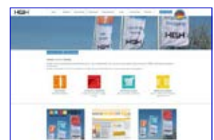
HGH Lüdenscheid www.hgh-luedenscheid.de