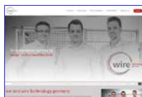
Wire Technology Germany www.wire-technology-germany.de