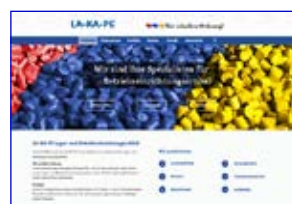
Alfred Häner GmbH www.la-ka-pe.de