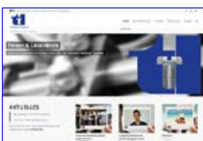
Tweer & Lösenbeck www.tweer-loesenbeck.de

Webhosting im hochsicheren Rechenzentrum in Lüdenscheid zu deutschem Datenschutz.