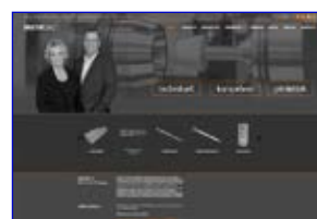
MSTBtec 2 www.mstbtec.de