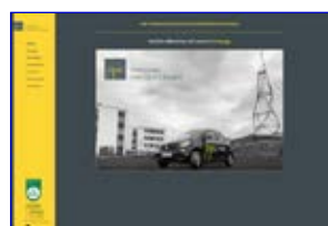
Personal Partner Cramer www.ppc-luedenscheid.de